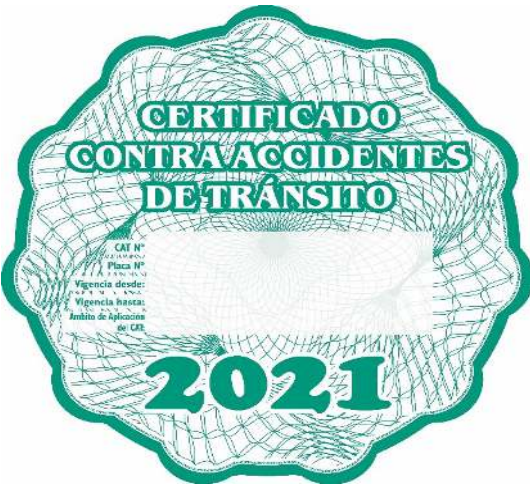
IMAGEN DEL HOLOGRAMA